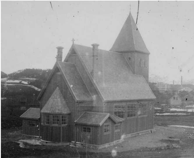
Ålgård kirke som ny i 1917.