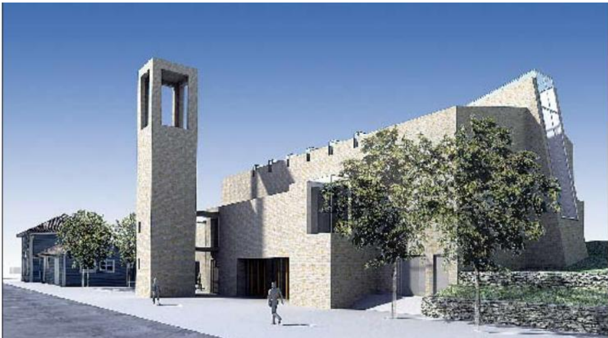
Skisseforslaget fra 2006 møtte en del innvendinger fordi den gamle kirken måtte rives. Løsningen ble å bygge ny i Prestehagen.