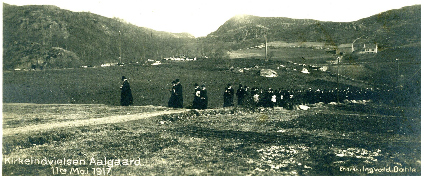
I flokk og følge fra bedehuset Bethel til den nye kapellkirken. Biskop Bernt Støylen i spissen. Gårdshusene på Ålgård bak. Bildet over og under fra Ålgård Rotarys bildearkiv.