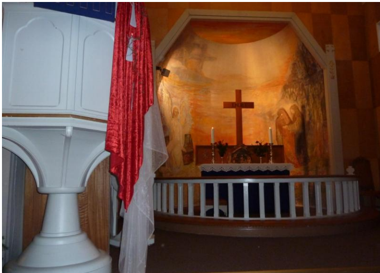
Altermaleri av Erling Hodne med motiv fra påskemorgen

gjorde mye for at det skulle være fint både inne og ute. De sørget for å bygge gravkapellet som ble vigslet 6. november 1938. De kjøpte nye lysekroner i forbindelse med restaureringen i 1960. Ålgård Vel bidro også med penger til ny messehaker og med 10.000,- til altermaleri. Maleriet dekker hele apsisen, som opprinnelig hadde vinduer, og er ca 25 kvadratmeter stort. Det kom på plass i 1969 og ble malt av Stavangerkunstneren Erling Hodne. Landskapsbildene hans er ofte fra Jæren, med høy himmel og drivende skyer. I Norsk kunstnerleksikon kan vi lese at enkelte kritikere antyder et slektskap til Hertervigs kunst. Hodnes bilder som er inspirert av Bibelen har gjerne vandrere som hovedtema. Hodnes verk ble valgt etter intern konkurranse i Stavanger bildende kunstners forening og har motiv fra påskemorgen. Hodne malte også nytt alterbilde til Hundvåg kapell i 1976.