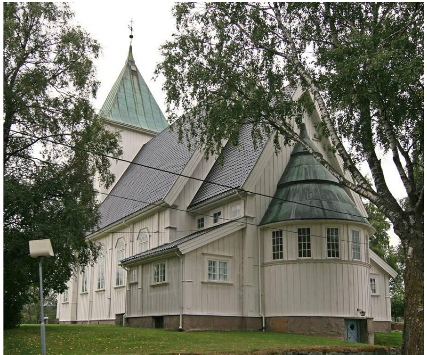
Frogner nye kirke, Sørumsund.