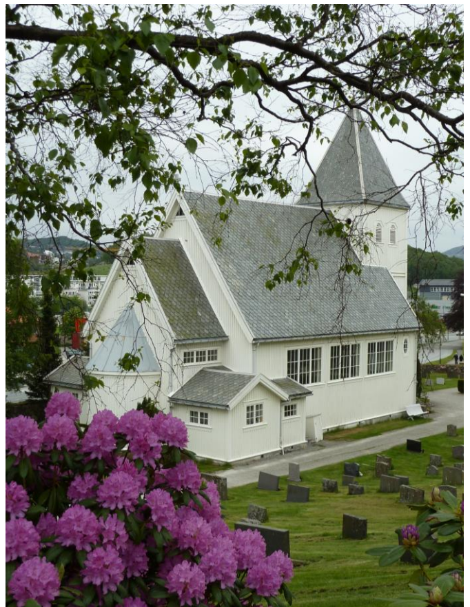
Ålgård gamle kirke i dag