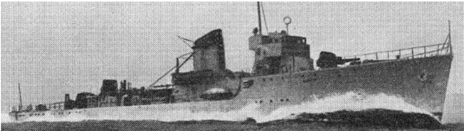
Æger, eller Ægir som man også skrev, var en relativt godt bestykket jager fra 1936.