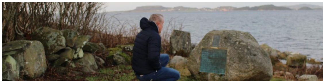
Minnesteinen på Skeie der to kobberrelieff minner om Ægers kamp. Til høyre nærbilde av det øverste relieffet