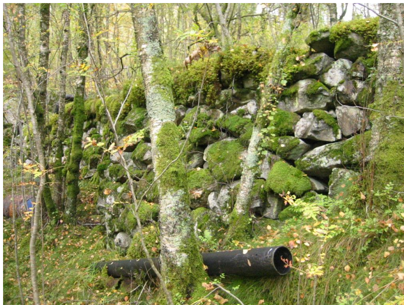
Fig.3 En av steinmurene i Røyrdalen med åker på innsiden. Høyde ca. 2 -3m.