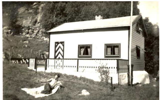
Fig.4 Låve og hytte i Røyrdalen (gjengitt med tillatelse av Harald Torkelsen).