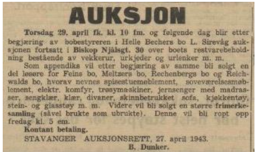
Annonsen fra Dagbladet Rogaland 28. april 1943

Auksjonene innbrakte i alt vel 50 000 kroner. Reichwalds innbo ble solgt for 2 708 kr, Feins for 10 477 kr. Med disse auksjonene var den økonomiske tilintetgjørelsen av jødene i Rogaland fullført.