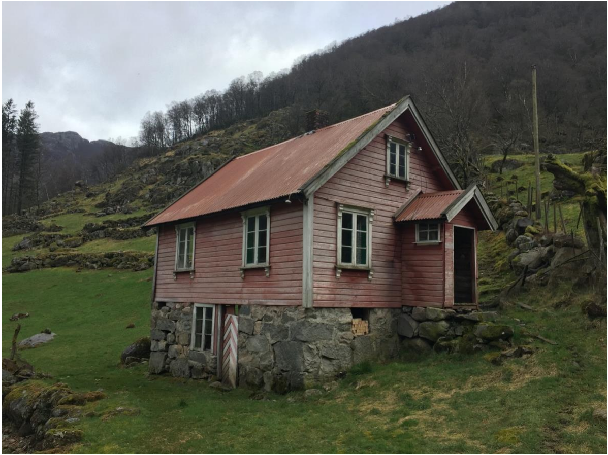
Huset i Frafjord der familiene Fein og Reichwald søkte tilflukt. Foto fra 2020.