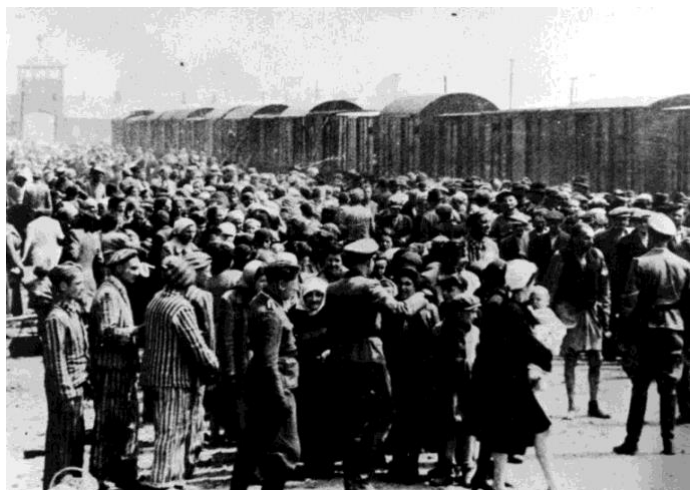
Seleksjonsrampen i Auschwitz/Birkenau