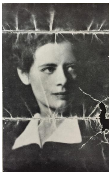
Malcolm hadde alltid bildet av Lointaine med seg