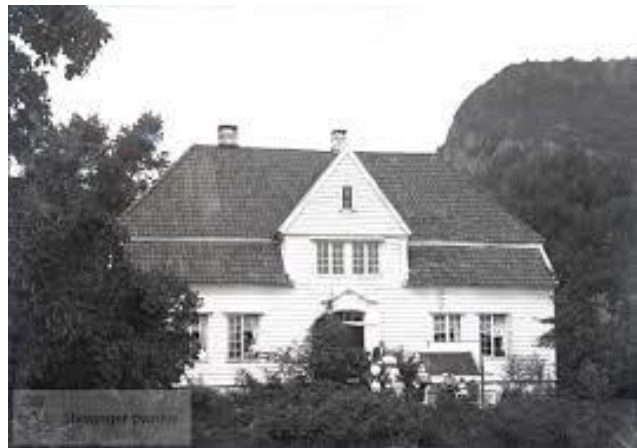
Presteboligen i Nedstrand