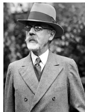
Malcolms far, Axel Munthe